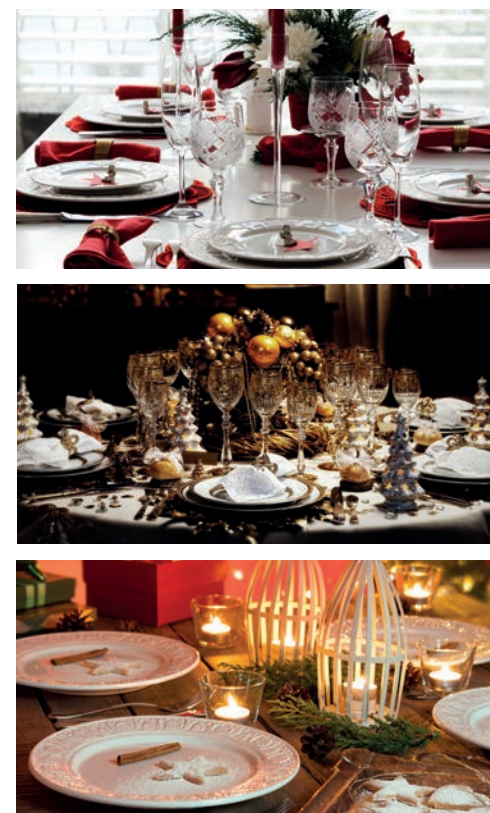
Tavola Country ideale per la festa e la celebrazione in montagna o in campagna nelle vecchie case. Questa tavola deve avere il legno, le candele, il rosso, il verde e il bianco pungitopo e tutti gli elementi della natura: bacche rosse, melagrana. È una tavola che ricorda i tempi passati.

Tavola sfarzosa è sfavillante e vuole stupire abbina al bianco solitamente l'oro e l'argento e i simboli del natale pigne e candele come potete vedere in questa immagine. Potete giocare come volete, ma in genere domina il bianco il cristallo e le tonalità chiare.